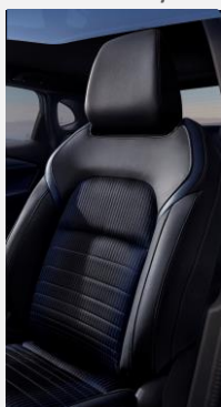
Černé látkové čalounění s tmavě modrými vločkami ze syntetické kůže