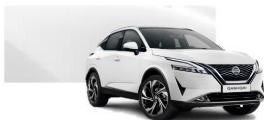
326 Bílá (8000 Kč)