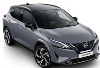
XFU Šedivá Pearl - Černá