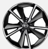
19" kola z lehké slitiny