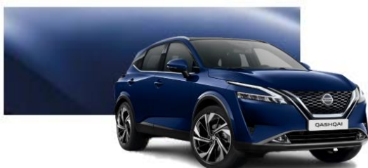
RBN Modrá Indigo