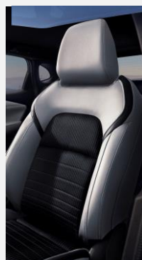
Černé látkové čalounění s bílými vločkami ze syntetické kůže