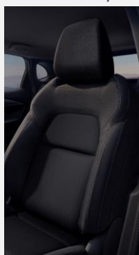
Černé látkové čalounění