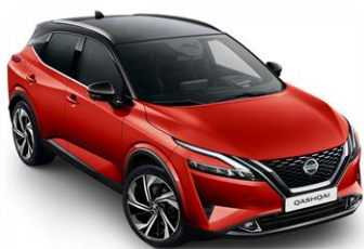
XEY Červená Sunset - Černá