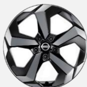
18" kola z lehké slitiny