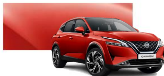
NBV Červená Sunset