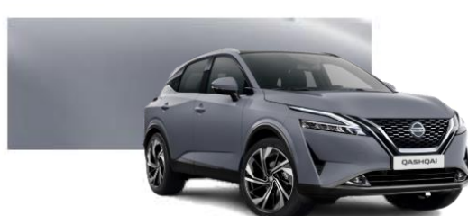
KBY Šedivá Pearl