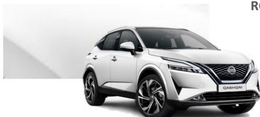
QAB Bílá Pearl