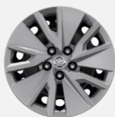
17" ocelové disky