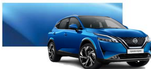
RCF Modrá Vivid