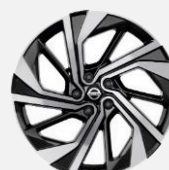
20" kola z lehké slitiny