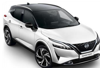
XDF Bílá Pearl - Černá