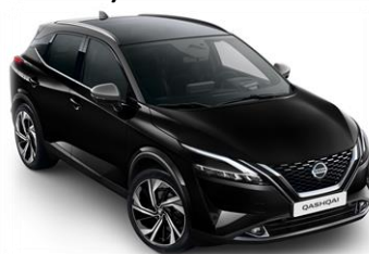
XDK Černá - Šedá