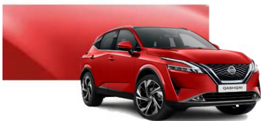
Z10 Červená (bez příplatku)