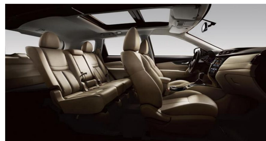
PERFOROVANÁ KŮŽE - BÉŽOVÁ