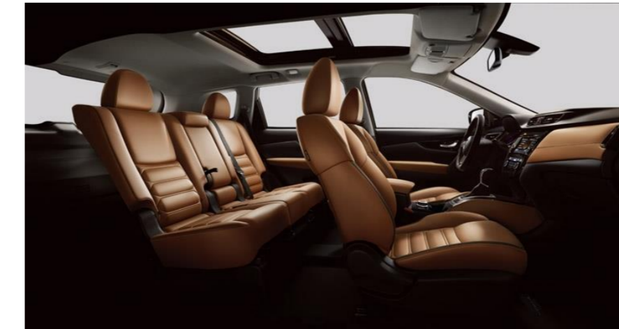
TMAVĚ HNĚDÁ TAN KŮŽE SE SPECIÁLNÍM PROŠÍVÁNÍM