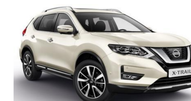
QAB Bílá Pearl