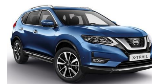
RAW Safírově modrá