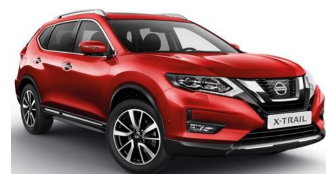
NBF Tmavě červená