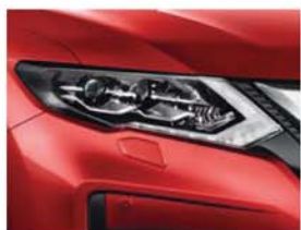
Tmavě červená - CP - NBF