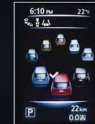
VÝBĚR BARVY VOZU NA DISPLEJI