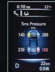
SYSTÉM MONITOROVÁNÍ TLAKU V PNEUMATIKÁCH