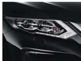
Černá - P - G41