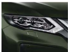
Olivová Titanium - PM - EAN