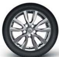
17" hliníková kola (stříbrně lakovaná)