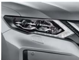
Stříbrná Blade - M - K23