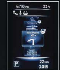
NAVIGACE KROK ZA KROKEM