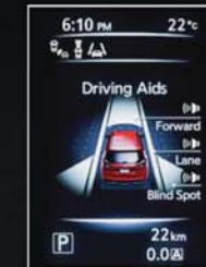
ASISTENČNÍ SYSTÉMY ŘIDIČE