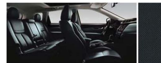
PERFOROVANÁ KŮŽE - ČERNÁ