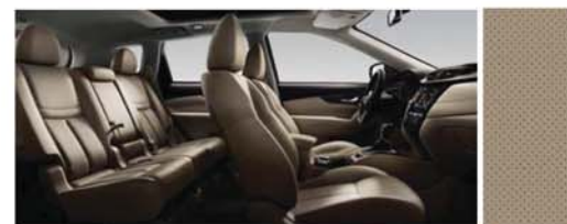
PERFOROVANÁ KŮŽE - BÉŽOVÁ