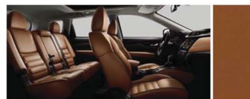
TMAVĚ HNĚDÁ TAN KŮŽE SE SPECIÁLNÍM PROŠÍVÁNÍM