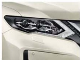
Bílá Pearl - 3P - QAB