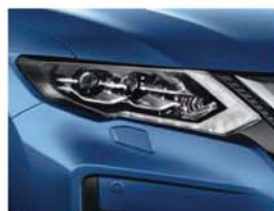
Modrá Vivid - PM - RAW