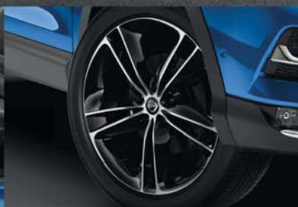
19" hliníková kola, dvoubarevná černo-bílá