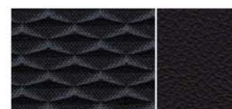
KOMBINACE ČERNÉ KŮŽE A TEXTILNÍHO ČALOUNĚNÍ, MONOFORMNÍ SEDADLA