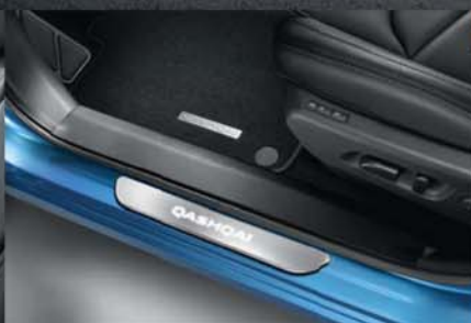
Osvětlené prahové lišty