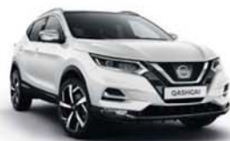
BÍLÁ - S - 326