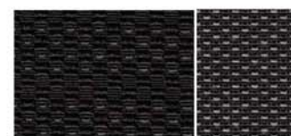
ČERNÉ TEXTILNÍ ČALOUNĚNÍ, MONOFORMNÍ SEDADLA