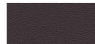
MODRÁ PRÉMIOVÁ KŮŽE NAPPA, MONOFORMNÍ SEDADLA