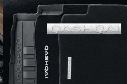
Černé pryžové rohože, velurové koberečky, luxusní textilní rohože