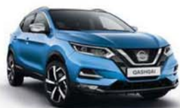
MODRÁ VIVID - M - RCA