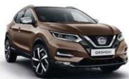
BRONZOVÁ CHESTNUT - M - CAN