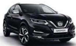
ČERNÁ NIGHT SHADE - M - GAB