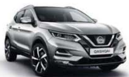
STŘÍBRNÁ SATIN - M - KYO