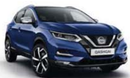
MODRÁ INK - M - RBN