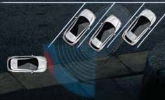
UPOZORNĚNÍ NA PROJÍZDĚJÍCÍ VOZIDLA