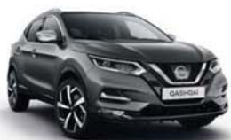
ŠEDÁ - M - KAD