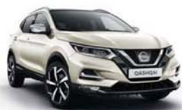
BÍLÁ PEARL - M - QAB