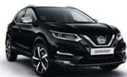
ČERNÁ PEARLESSENT - M - Z11