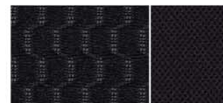
ČERNÉ TEXTILNÍ ČALOUNĚNÍ