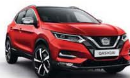
ČERVENÁ FLAME - S - Z10