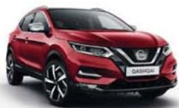
ČERVENÁ MAGNETIC - M - NAJ