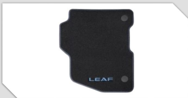
Velurové koberečky s dvojitým modrým prošíváním, (sada 4ks)