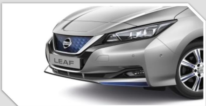
Modrá lišta předního nárazníku