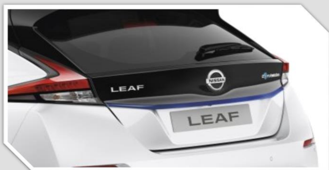
Modrá dolní lišta zavazadlového prostoru