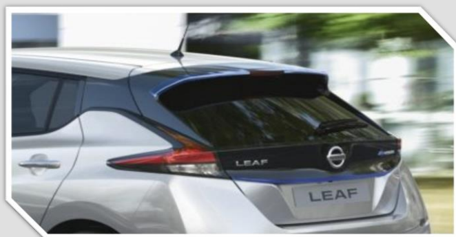
Modrá zadní hrana spoileru