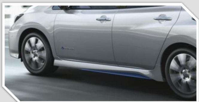
Modré prahové lišty