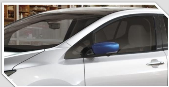
Modré kryty zrcátek